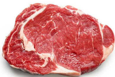
1 Kg di carne di manzo