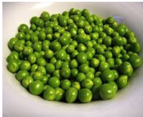
1 kg di piselli