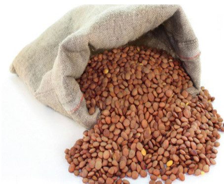
1 kg di lenticchie