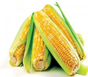
1 kg granoturco