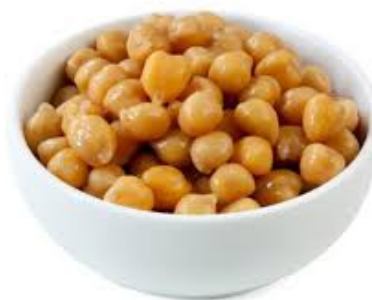
1 kg di ceci