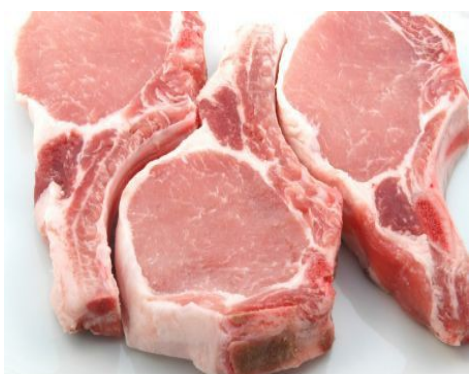
1 Kg di carne suina