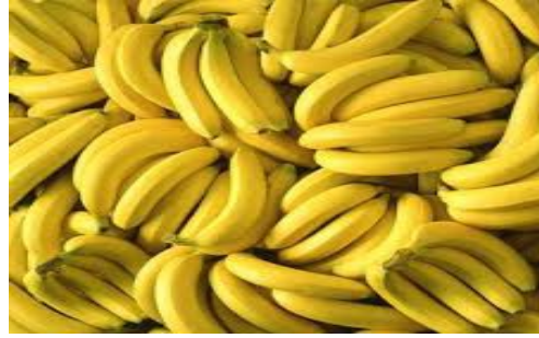
1 Kg di banane