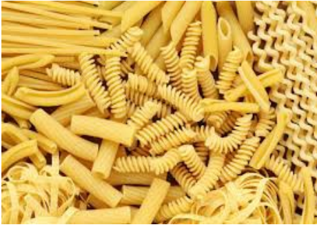
1 Kg di pasta