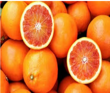
1 kg di arance