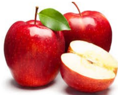
1 kg di mele