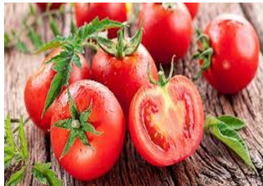
1 kg di pomodori