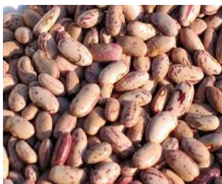
1 Kg di fagioli