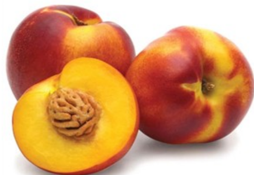
1 kg di nocepesca