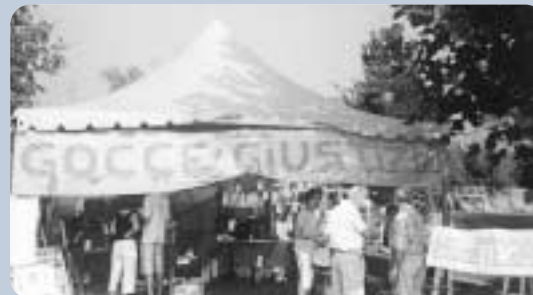
Boicottega: laboratorio per educare al consumo critico.

Promuovere relazioni umane giuste nei confronti dei popoli del sud e del nord del mondo (denuncia delle ingiustizie che impoveriscono e condannano alla miseria, protezione dei bambini e delle fasce sociali più deboli da condizionamenti e da comportamenti).