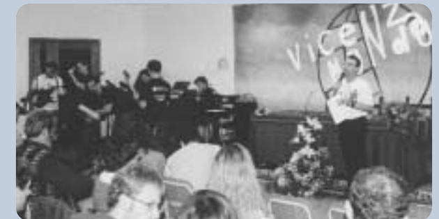
Vicenza Mondo: evento annuale con relazioni, mostre e musica.

Aderisce a realtà associative e a reti nazionali e locali (Rete Lilliput, Centro Nuovo Modello di Sviluppo, Festambiente, Primo Lunedì del mese, Banca Popolare Etica, ecc).